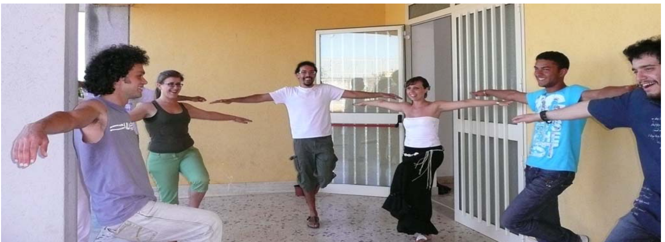
IMG 11: Workshop di Teatro