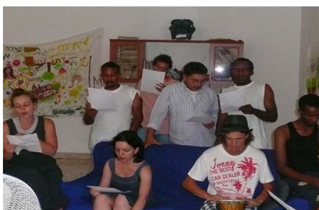
IMG 5 e 6: Workshop di Musica