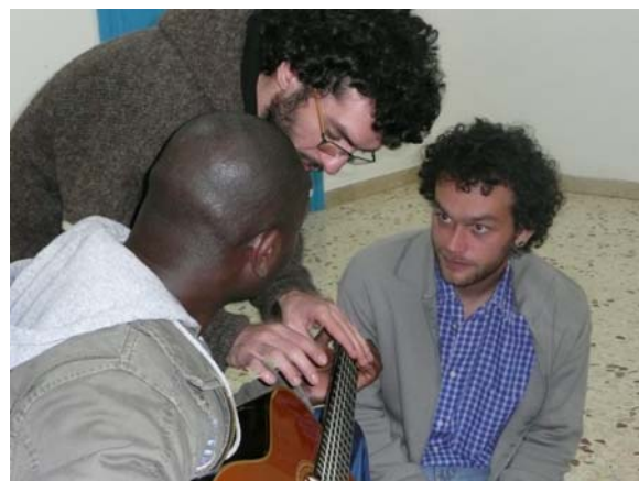
IMG2:Workshop di Musica