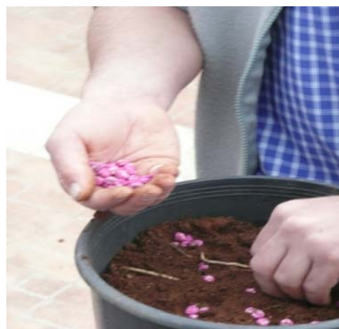
IMG 3 e IMG4: Workshop di Giardinaggio